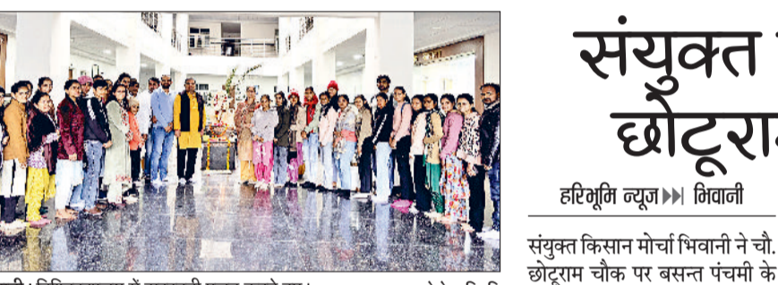
भिवानी। विश्वविद्यालय में सरस्वती पूजन करते हुए।