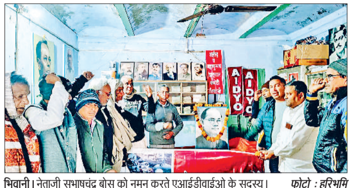
भिवानी। नेताजी सुभाषचंद्र बोस को नमन करते एआईडीवाईओ के सदस्य।