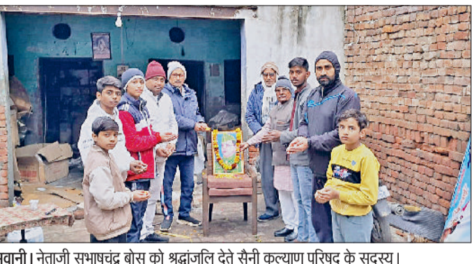
भिवानी। नेताजी सुभाषचंद्र बोस को श्रद्धांजलि देते सैनी कल्याण परिषद के सदस्य।