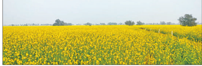
हरिभूमि न्यूज भिवानी

कुछ किसानों के चेहरे खिले और कुछ के मुरझाए, वाहन चालक भी रहे परेशान