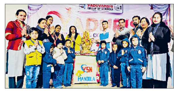
भिवानी। विद्या की देवी मां सरस्वती पूजन करते शिक्षक व विद्यार्थी।

चरखी दादरी। आदर्श कोचिंग सेंटर में बसंत पंचमी पर हवन का आयोजन किया गया। इस अवसर पर भारत माता के महान सपूत सुभाषचंद्र बोस को श्रद्धांजलि भी दी गई। कार्यक्रम के दौरान आयोजित विधिवत हवन-पूजन में वैदिक मंत्रोच्चार के बीच संस्थान के स्टाफ और विद्यार्थियों ने यज्ञ में आहुतियां डाली और पूर्ण श्रद्धाभाव से पूजा-अर्चना की।