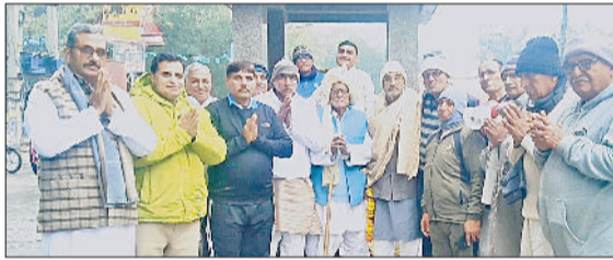
भिवानी। विद्या की देवी मां सरस्वती पूजन करते शिक्षक व विद्यार्थी।

को साहूकारों व अंग्रेजों से बचाने के लिए मार्ग लड़ी थी, आज इनके दिशाएं मार्ग पर चलते हुए भाजपा से देश व प्रदेश को बचाने के लिए लड़ाई लड़नी होगी तथा ये जिम्मेदारी कांग्रेस कार्यकर्ताओं के कंधों पर है। गुलिया ने कहा कि कांग्रेस पार्टी का कुनबा लगातार बढ़ रहा है।