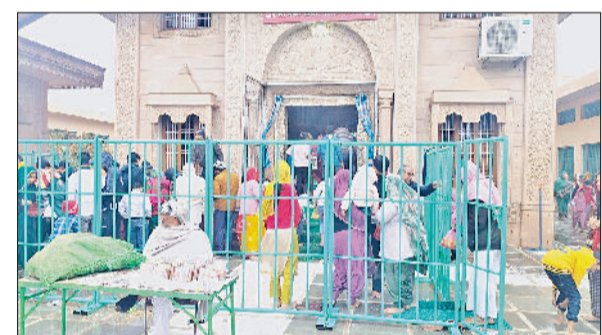
भिवानी। खरक मंदिर में पूजा अर्चना करते हुए।