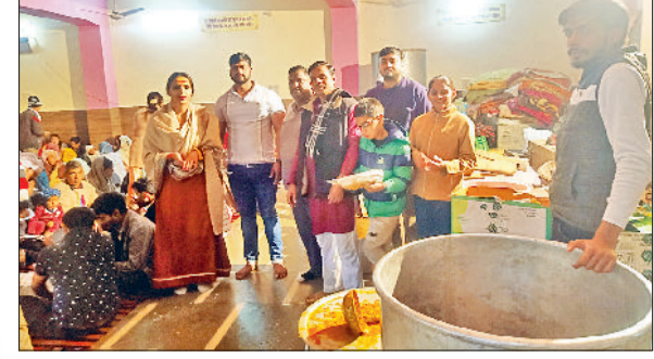
बवानीखेड़ा। बसंत पंचमी पर डेरा बाबा रामरूप में प्रसाद की सेवा करते हुए।