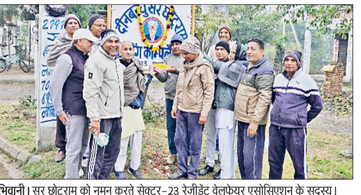
भिवानी। सर छोटूराम को नमन करते सेक्टर-23 रेजीडेंट वेलफेयर एसोसिएशन के सदस्य।