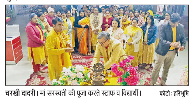
चरखी दादरी। मां सरस्वती की पूजा करते स्टाफ व विद्यार्थी।

बवानीखेड़ा। आनंद स्कूल फॉर एक्सीलेंस में राष्ट्रीय सड़क सुरक्षा माह, स्वामी विवेकानंद जयंती, नेताजी सुभाष चंद्र बोस जयंती एवं बसंत पंचमी का संयुक्त आयोजन किया गया। कार्यक्रम का उद्देश्य विद्यार्थियों में यातायात नियमों के प्रति जागरूकता पैदा करना, महान विभूतियों के विचारों से प्रेरणा लेना तथा भारतीय संस्कृति व परंपराओं से जोड़ना रहा। इस अवसर पर विद्यार्थियों को राष्ट्रीय सड़क सुरक्षा माह के महत्व के बारे में बताया गया।