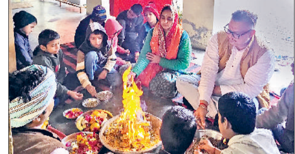
चरखी दादरी। हवन में आहुति डालते शिक्षक व विद्यार्थी।